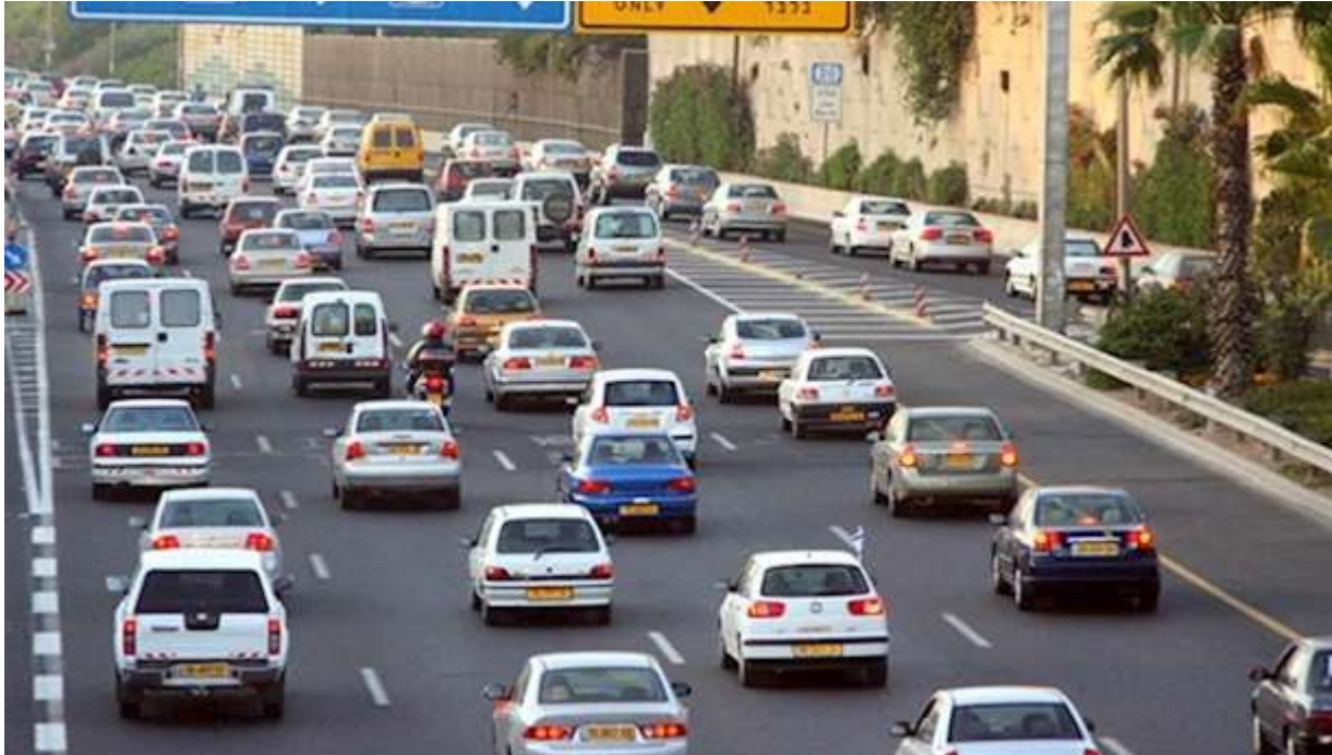
פקקים