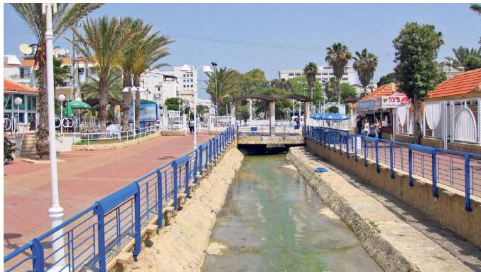
שדרות הגעתון בנהריה. "מתחם חדש של עירוב שימושים ייחודי"