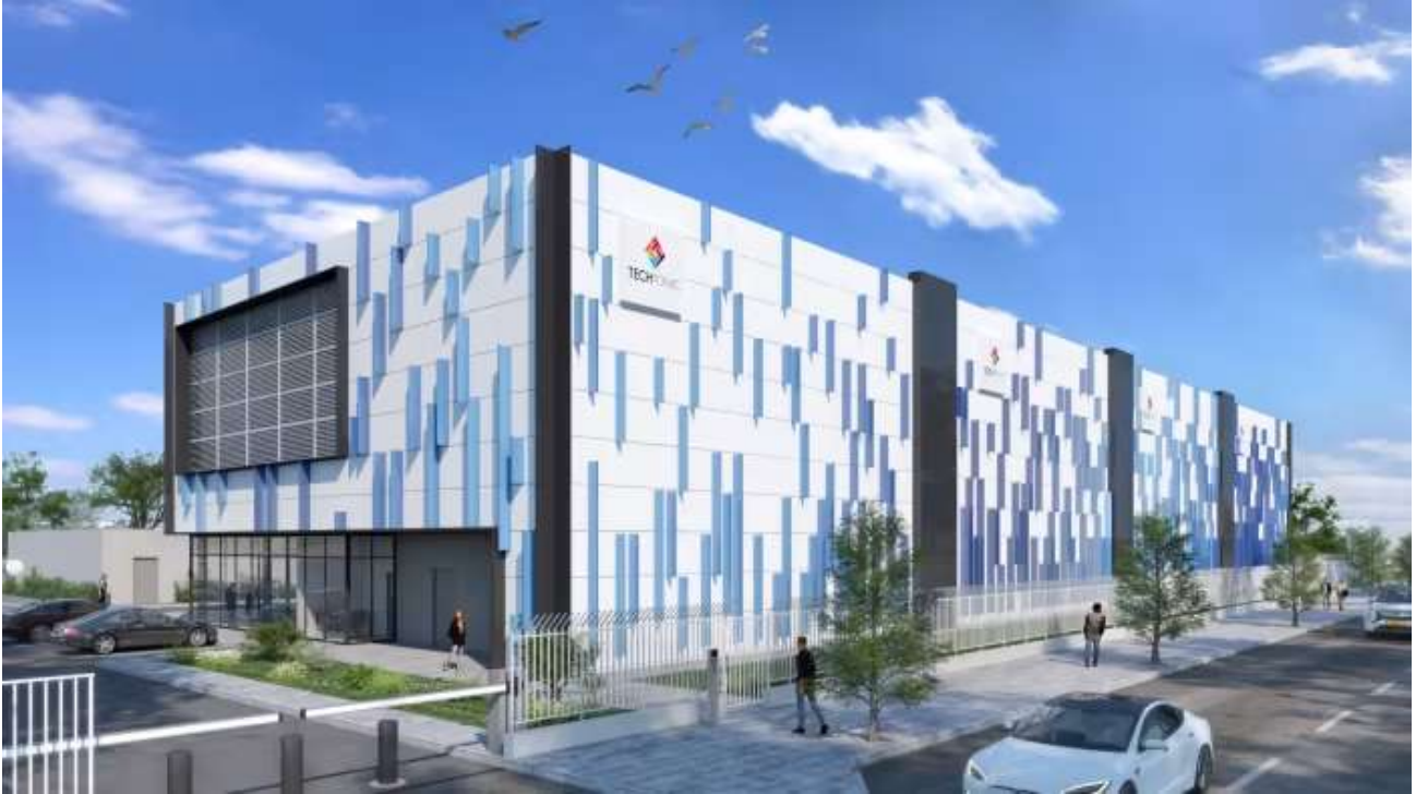
חוות שרתים חדשה שתיבנה באזור התעשייה בבית שמש

תצורת המערכות במתקן כפולה, ומבטיחה יכולת אחזקה ותפעול רציפה גם לאחר אירוע הנובע מתקלה או אירוע מלחמתי.