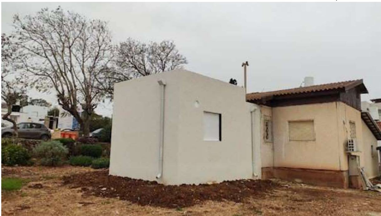
ממד חדש בצפון

ממשרד הביטחון מסרו הבוקר (ראשון) כי פרויקט "מגן הצפון" שבמסגרתו נבנים מאות ממ"דים חדשים בישראל, שכן הרבה מאוד בתים בצפון לא עומדים בתקנים, הן בשל השנה בה הם נבנו, והן כי מדובר בהרבה מאוד בתי קרקע שמרוחקים ממקלטים כאלה ואחרים, מתרחב, לאחר שמשרד הביטחון החל בבניית ממ"דים בקיבוץ אדמית, במקביל לבניית מאות ממדים ביישובים נוספים ברחבי הצפון. מנהלת מגן הצפון באגף ההנדסה והבינוי במשרד הביטחון, באמצעות חברת עמיגור, החלה בבניית ממ"דים ביישוב אדמית במועצה האזורית מטה אשר. במקביל מוקמים בימים אלו מאות ממ"דים ביישובים נוספים בגבול הצפון, בהם: משגב עם - שם נבנים 122