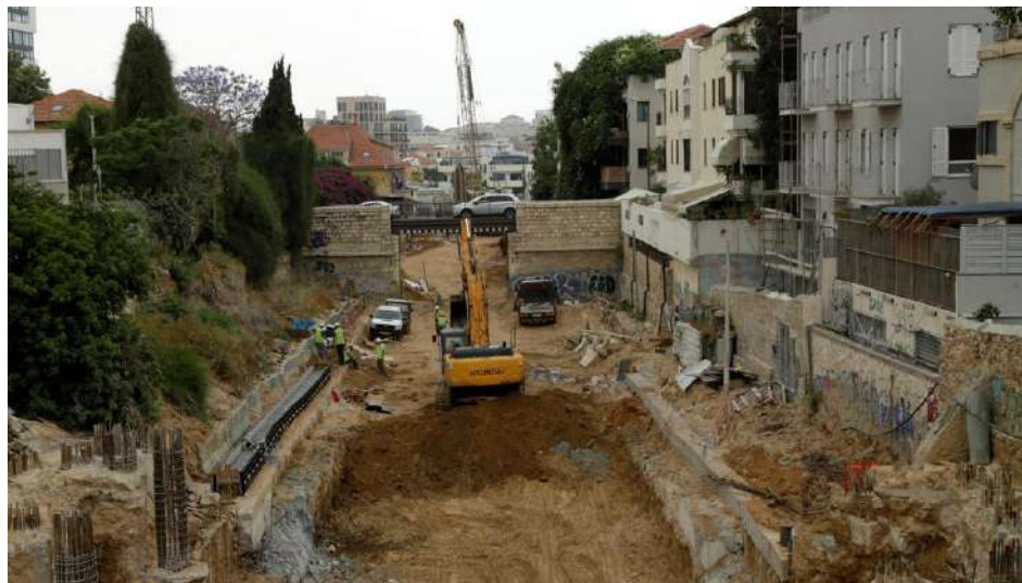
הכנת תשתית לרכבת בתל אביב. כבר היום יזמים נהנים מהטבות לבנייה סביב תחנות מטרו עתידיות