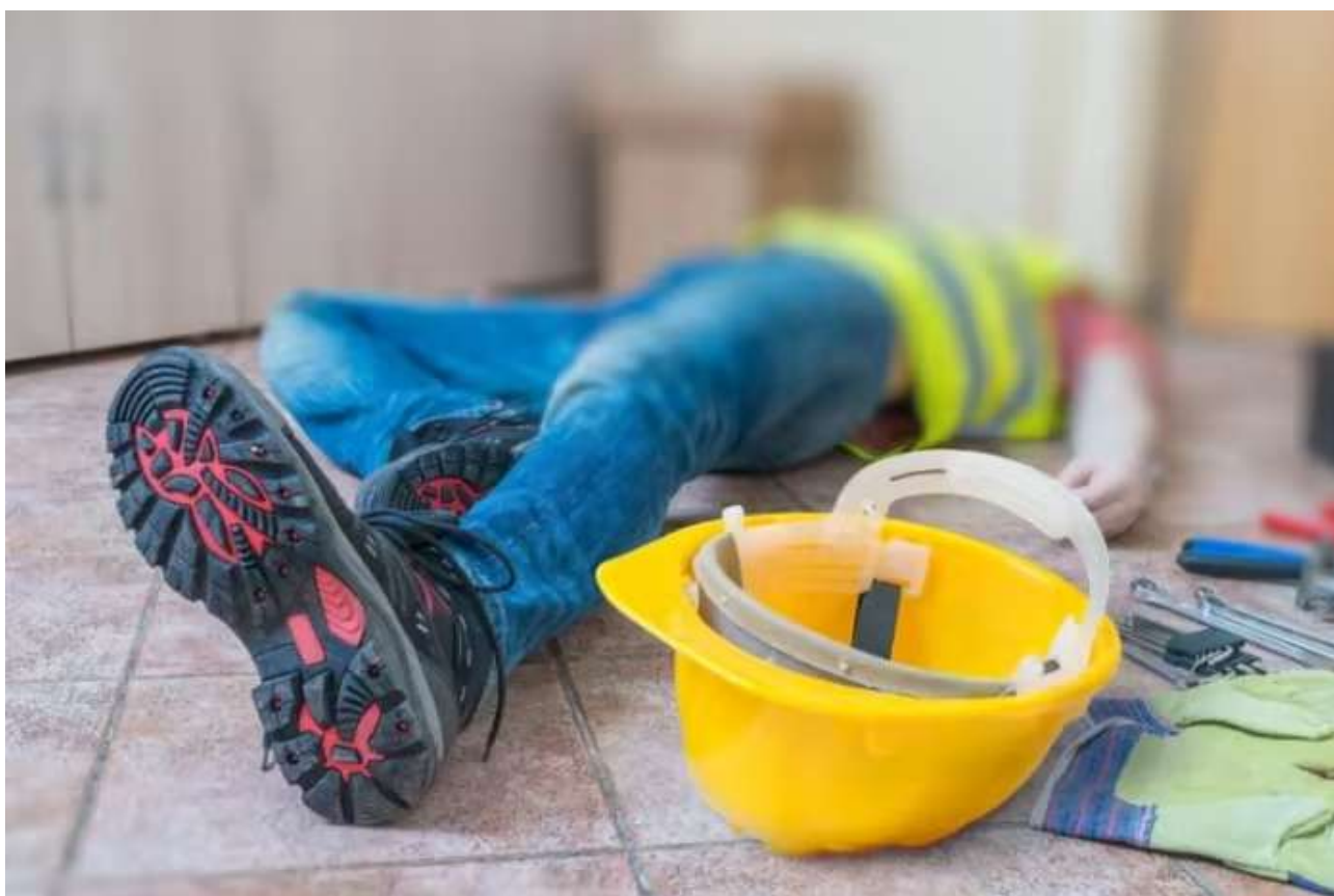
תאונת עבודה