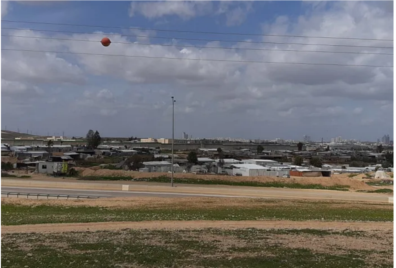
יישוב בדואי בסמוך לבאר שבע

בשבוע שעבר נקראו שוטרים לשלוש חתונות עם מאות משתתפים בדרום ופיזרו א ההתכנסויות. בעלי האירועים זומנו ל בגין הפרת הצו. אולם, בניגוד לכפריו מוכרים, ראש עיריית רהט פאיז אבו העיד כי בעירו - היישוב הגדול ביותר המודעות לנגיף עלתה בצורה ניכרת, רוב התושבים נשמעים להוראות. "לו קיבלתי החלטה להשהות את כל הת כולל תפילות יום שישי. אנשים נשמע להוראות. היו אנשים שצריכים להיות ולא היו. פעלנו יחד עם המשטרה לא זה", אמר אבו סייבהן.