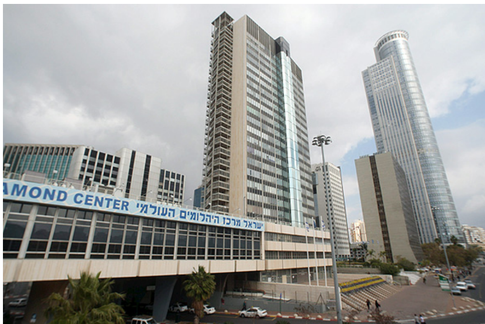
מתחם הבורסה ברמת גן

למרות מכתבו של כהן, מתן אפשרות הדחייה נותרה לשיקול דעתן של הרשויות, כאשר אין אחידות באופן שבו הן פועלות. חלקן הודיעו לציבור על דחית הגבייה לחודש מאי, ובחלק מהרשויות נמשכה גבייה אוטומטית של תשלומי ארנונה בהוראות קבע כמו ברמת גן למשל. "למרות שהמשרד סגור, ב-31 במרץ ירד תשלום ארנונה לעיריית רמת גן על החודשים מרץ ואפריל", אומר בעל משרד במתחם הבורסה בעיר. "עכשיו צריך ללכת לריב עם העירייה כדי לקבל את ההנחה שמגיעה".