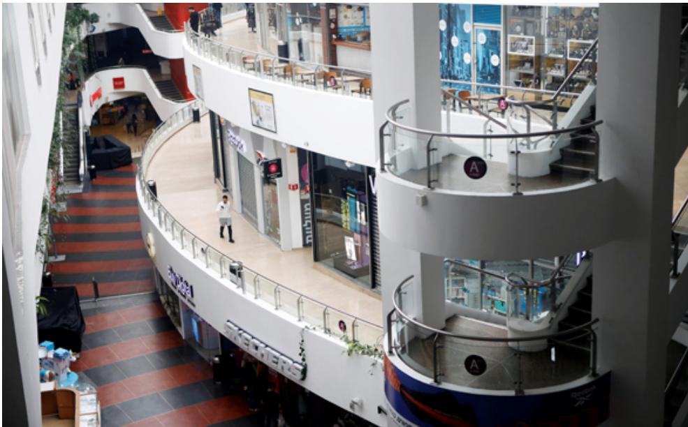
דיזינגוף סנטר ריק

יחד עם זאת, בחלק מהרשויות כבר נגבה תשלום ארנונה בגין החודשים מרץ ואפריל, זאת למרות שחלק ניכר מהעסקים סגורים ולא פעילים. בעלי עסקים אלה חוששים, כי מאחר והתשלום כבר נגבה מהם, לא יזכו לקבל את ההנחה.